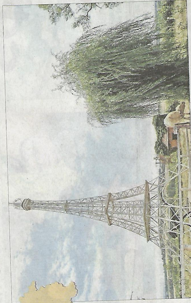
Cette reproduction de Tour Eiffel fait tiquer les protecteurs des paysages.

L a Société pour la protection des paysages et de l'esthétique de la France, la SPPEF, vient de demander au tribunal administratif de Dijon l'annulation d'une décision du maire de Lugny-lès-Charolles, autorisant les établissements Chambreuil à aménager un terrain en vue d'y établir un parking et une zone de manœuvre. En outre,